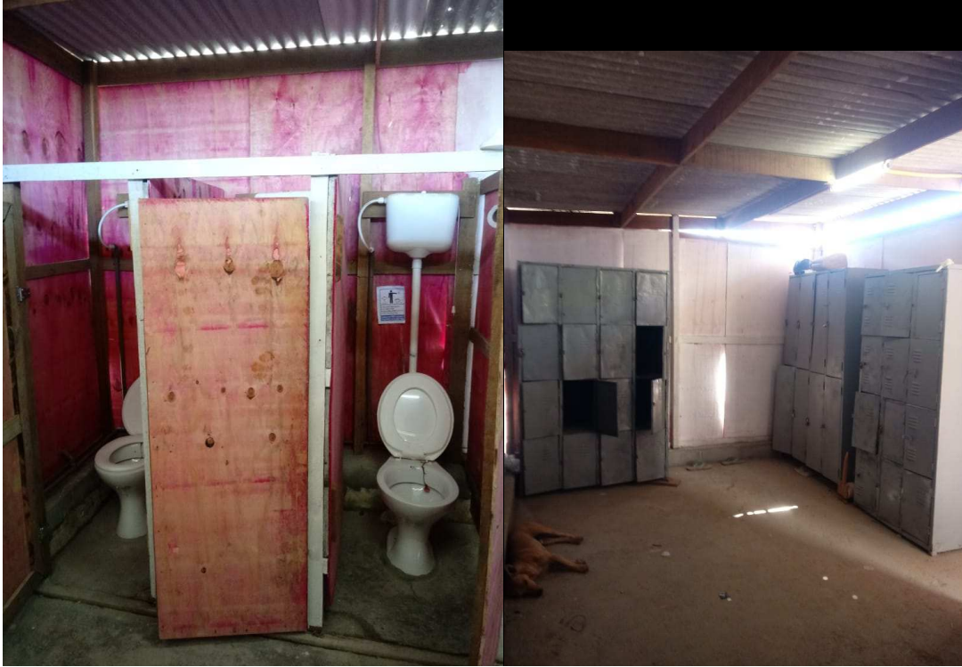
Figura 4 – Vista interna do vestiário com vasos sanitários (esquerda) e armários (direita)