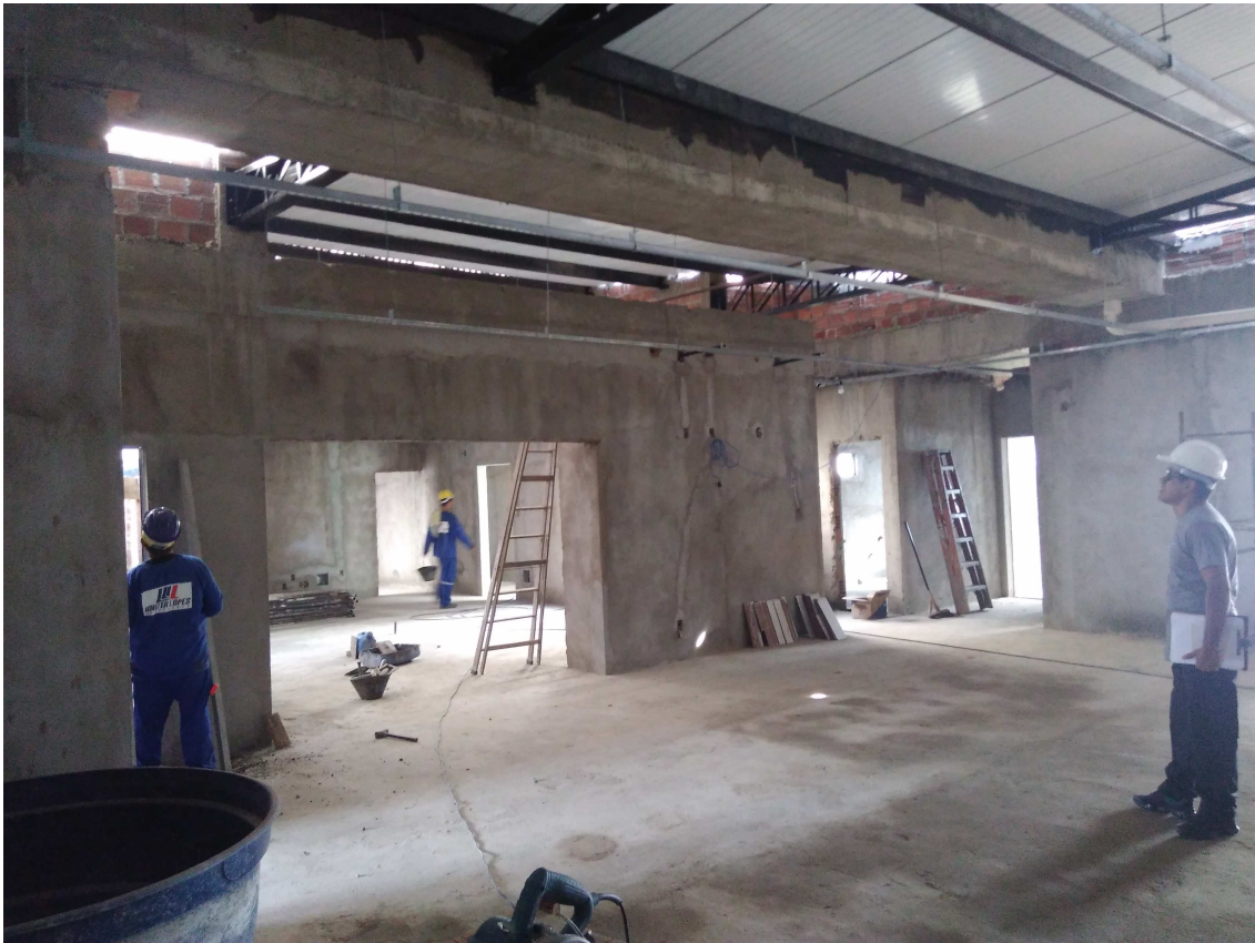
Figura 10 – Vista da Sala de espera (contrapiso, chapisco/reboco e pontos de instalações elétricas executados)