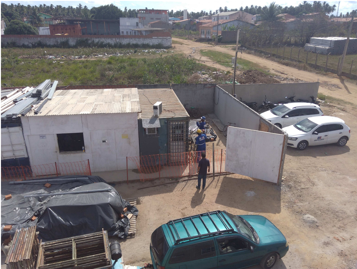
Figura 2 – Canteiro de obras