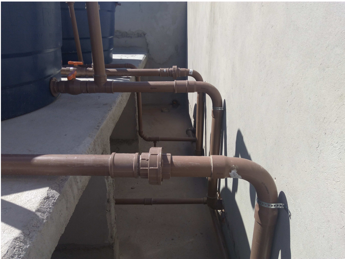
Figura 11 – Instalações hidráulicas dos reservatórios superiores