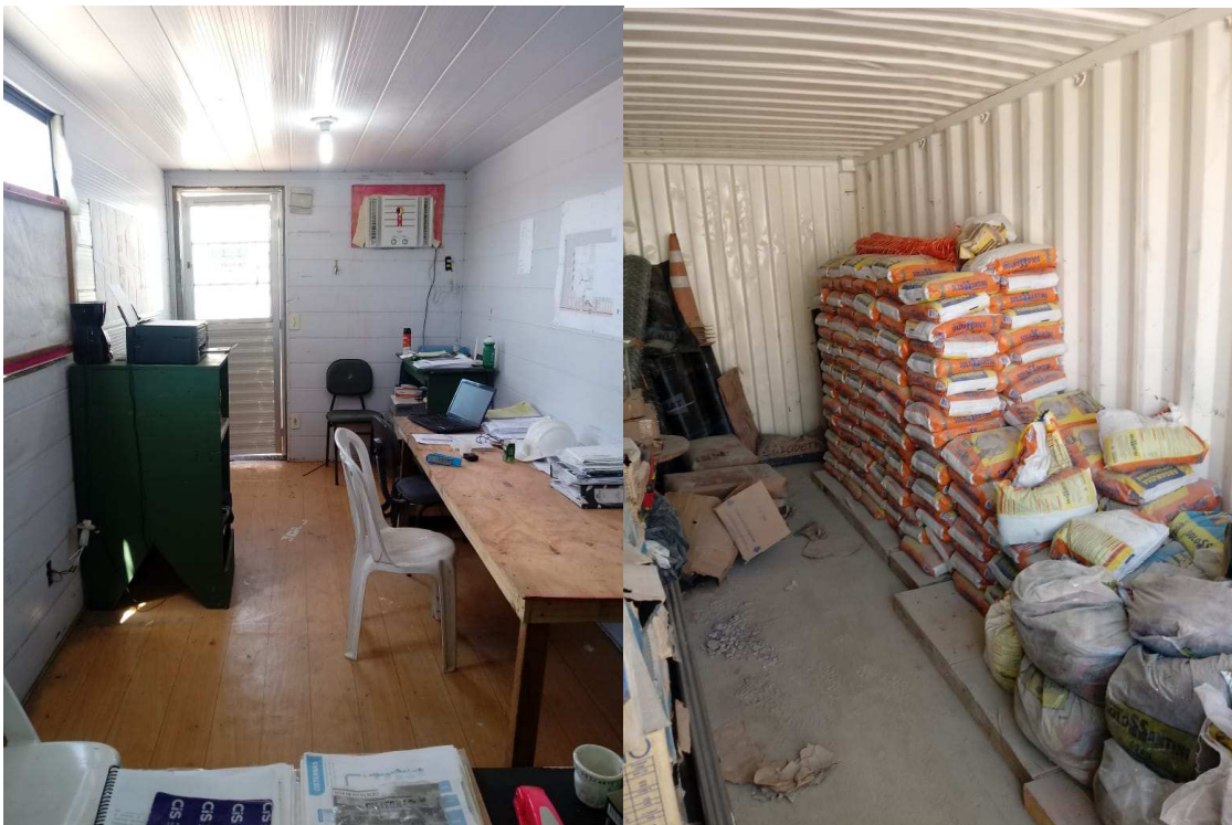
Figura 3 – Vista interna do escritório (esquerda) e depósito (direita)