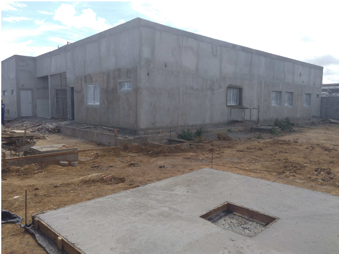
Figura 9 – Fachada posterior e fachada lateral esquerda