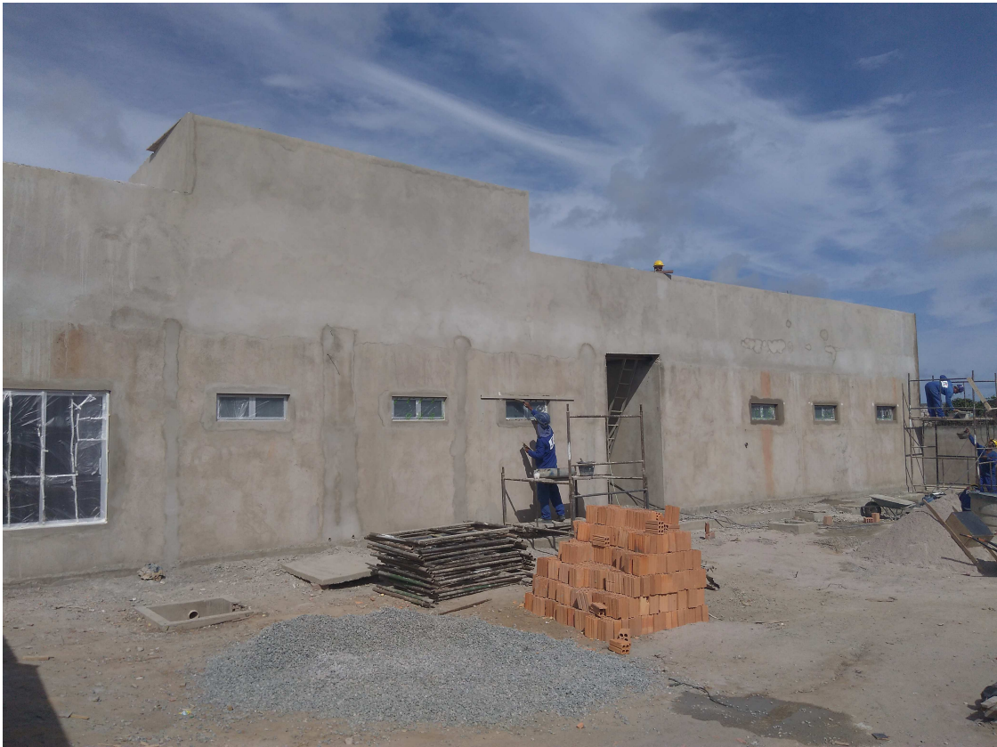
Figura 8 – Fachada lateral direita