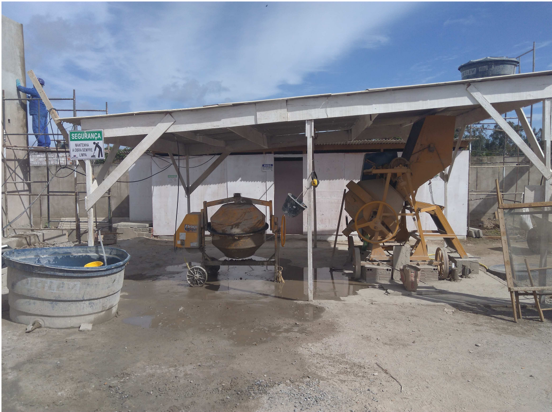
Figura 6 – Betoneiras instaladas