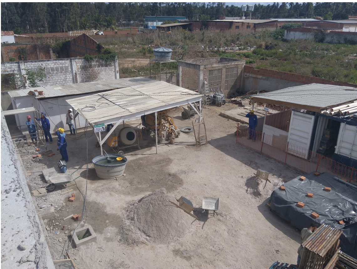
Figura 1 – Canteiro de obras

A seguir estão dispostas algumas fotos da obra. Este registro fotográfico pode ser complementado pelo Relatório Fotográfico elaborado pela contratada (Doc nº 233).