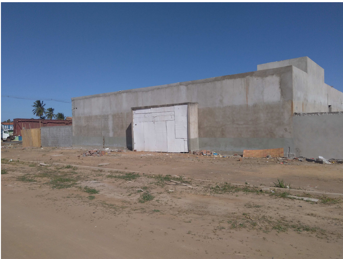
Figura 7 - Fachada Frontal