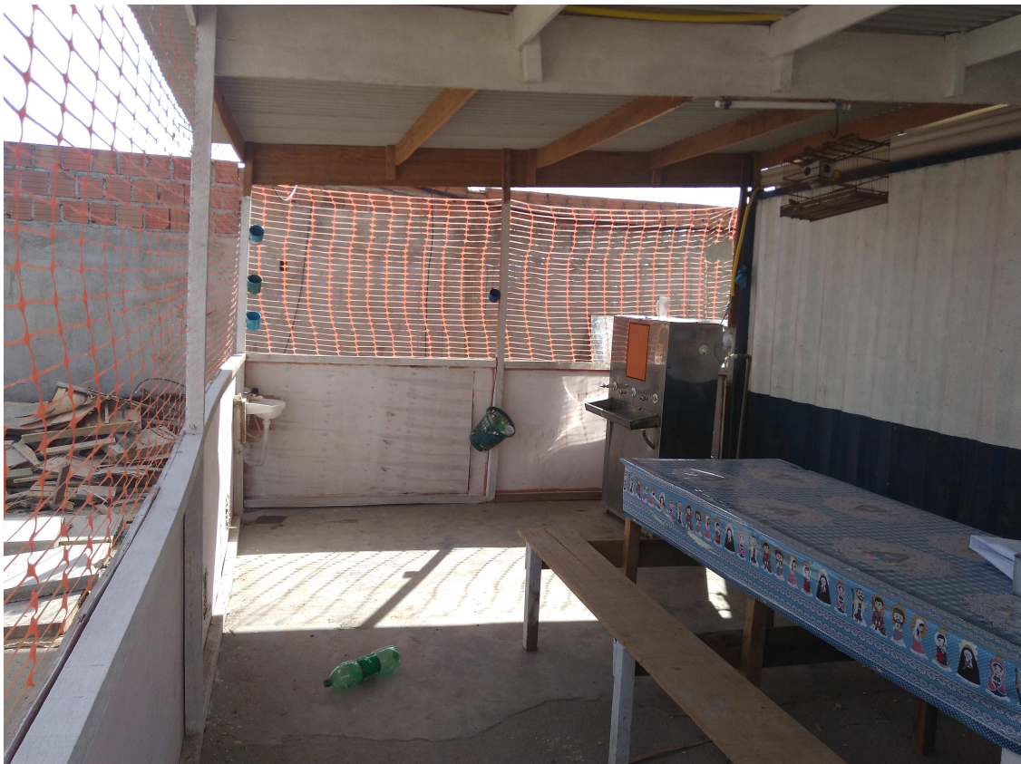
Figura 5 - Refeitório