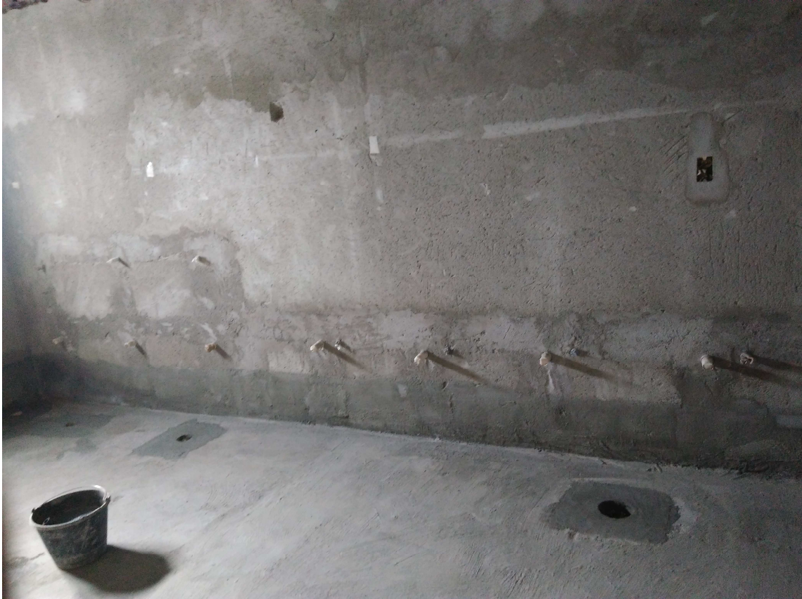
Figura 4 - Instalações de água e esgoto e impermeabilização