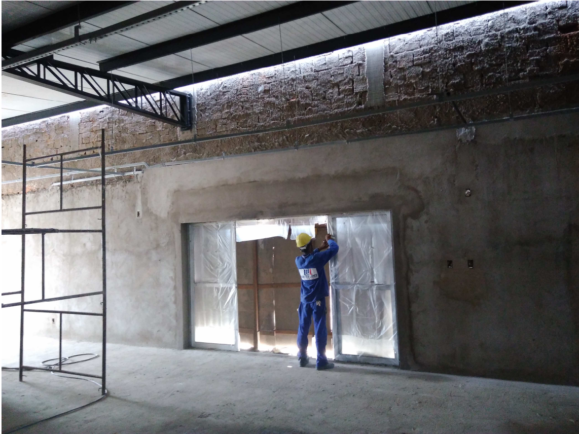
Figura 2 – Esquadria de alumínio (Porta de entrada)