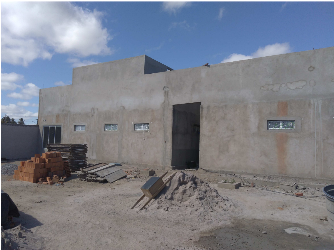
Figura 3 – Esquadrias de alumínio (Janelas da fachada lateral direita)