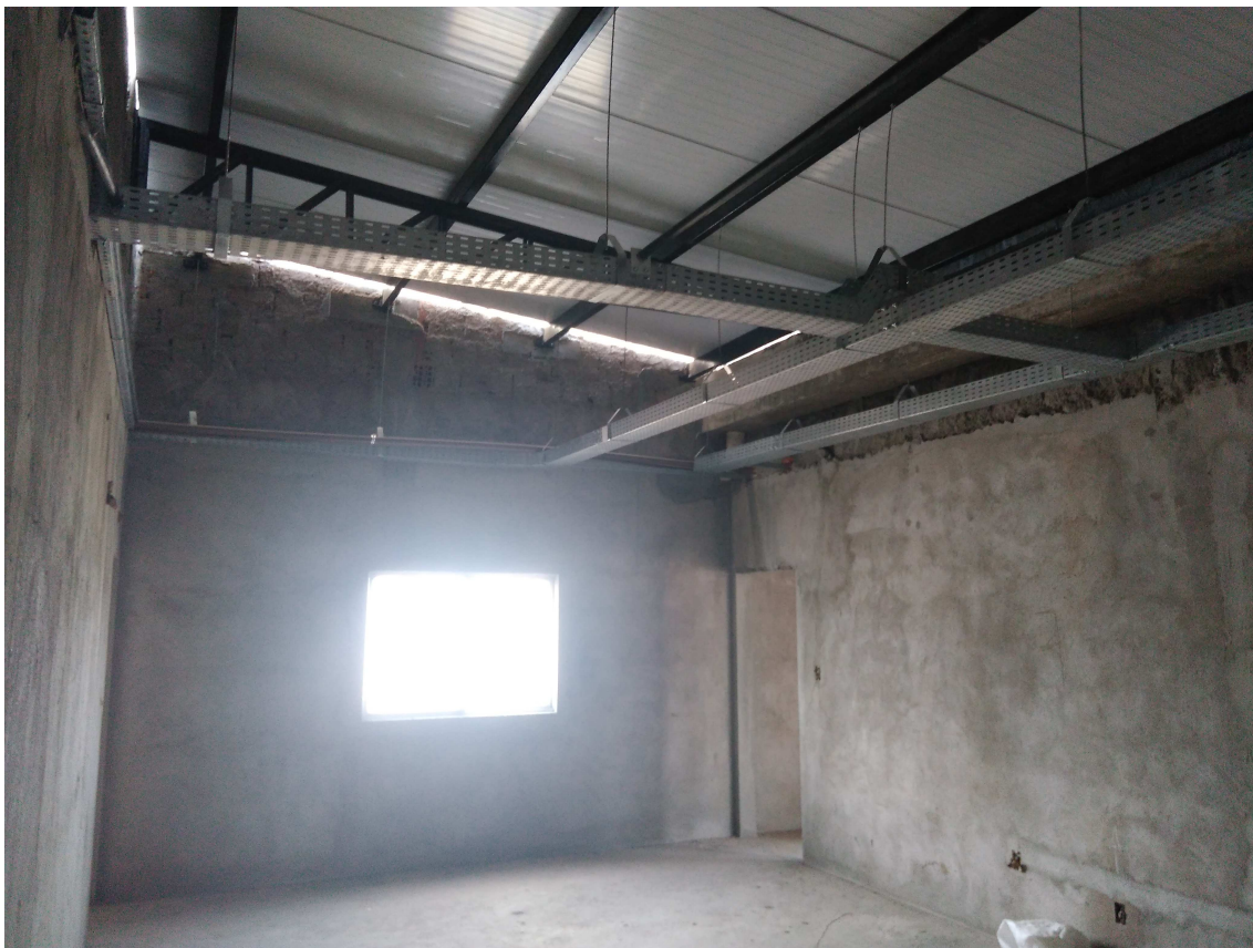
Figura 1 – Estrutura metálica da cobertura

A seguir estão dispostas algumas fotos da obra. Este registro fotográfico pode ser complementado pelo Relatório Fotográfico elaborado pela contratada (Doc nº 239).