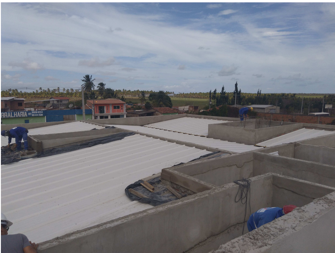
Figura 1 – Telhas termoacústicas

A seguir estão dispostas algumas fotos da obra. Este registro fotográfico pode ser complementado pelo Relatório Fotográfico elaborado pela contratada (Doc nº 245).