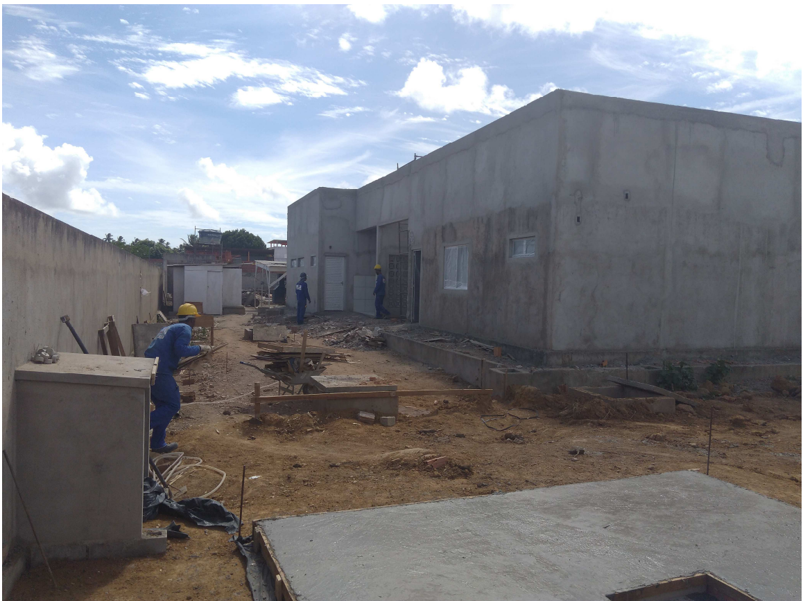
Figura 3 - Casa de bombas (esquerda)