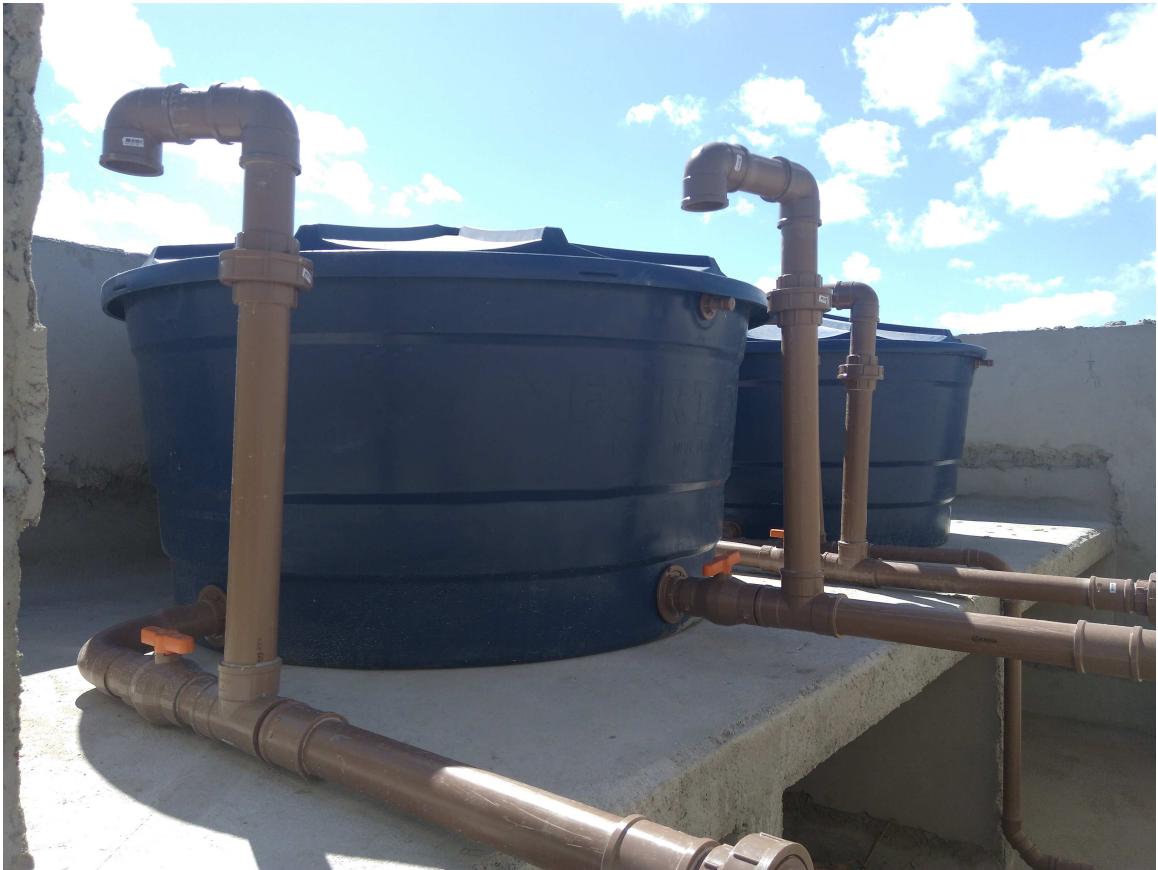
Figura 2 – Reservatórios superiores