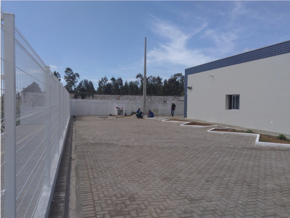
Figura 3 – Estacionamento interno (Lateral esquerda)