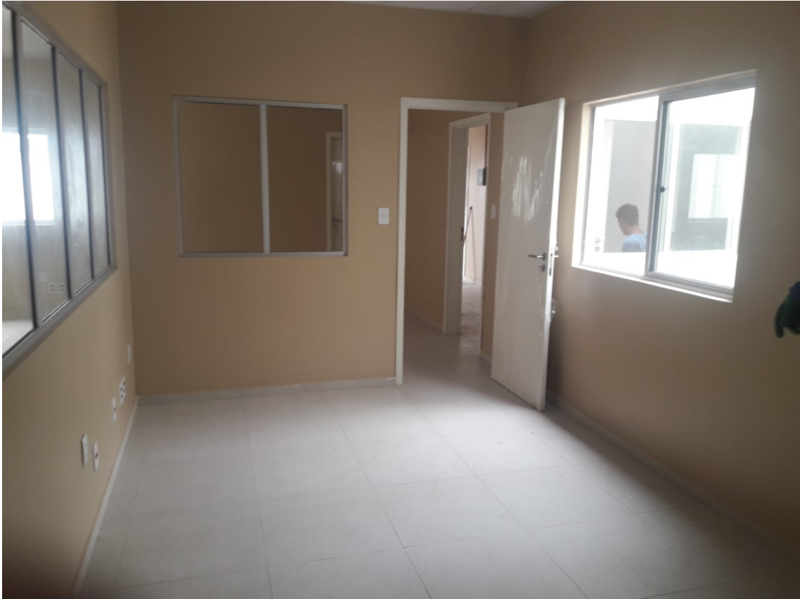
Figura 7 – Sala do Diretor