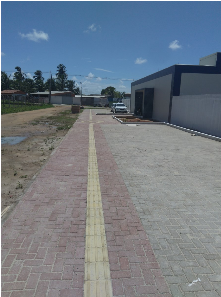
Figura 2 – Calçada (Fachada frontal)