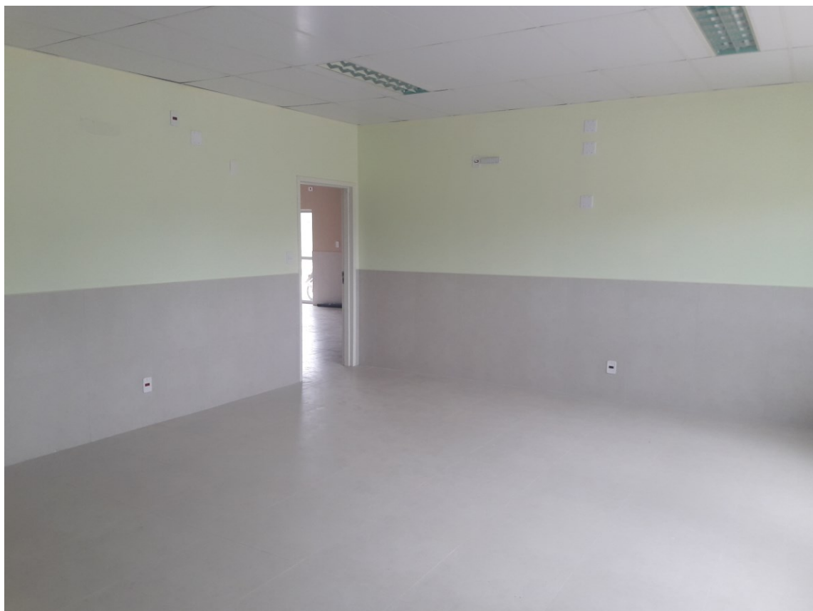
Figura 6 – Sala de Audiência