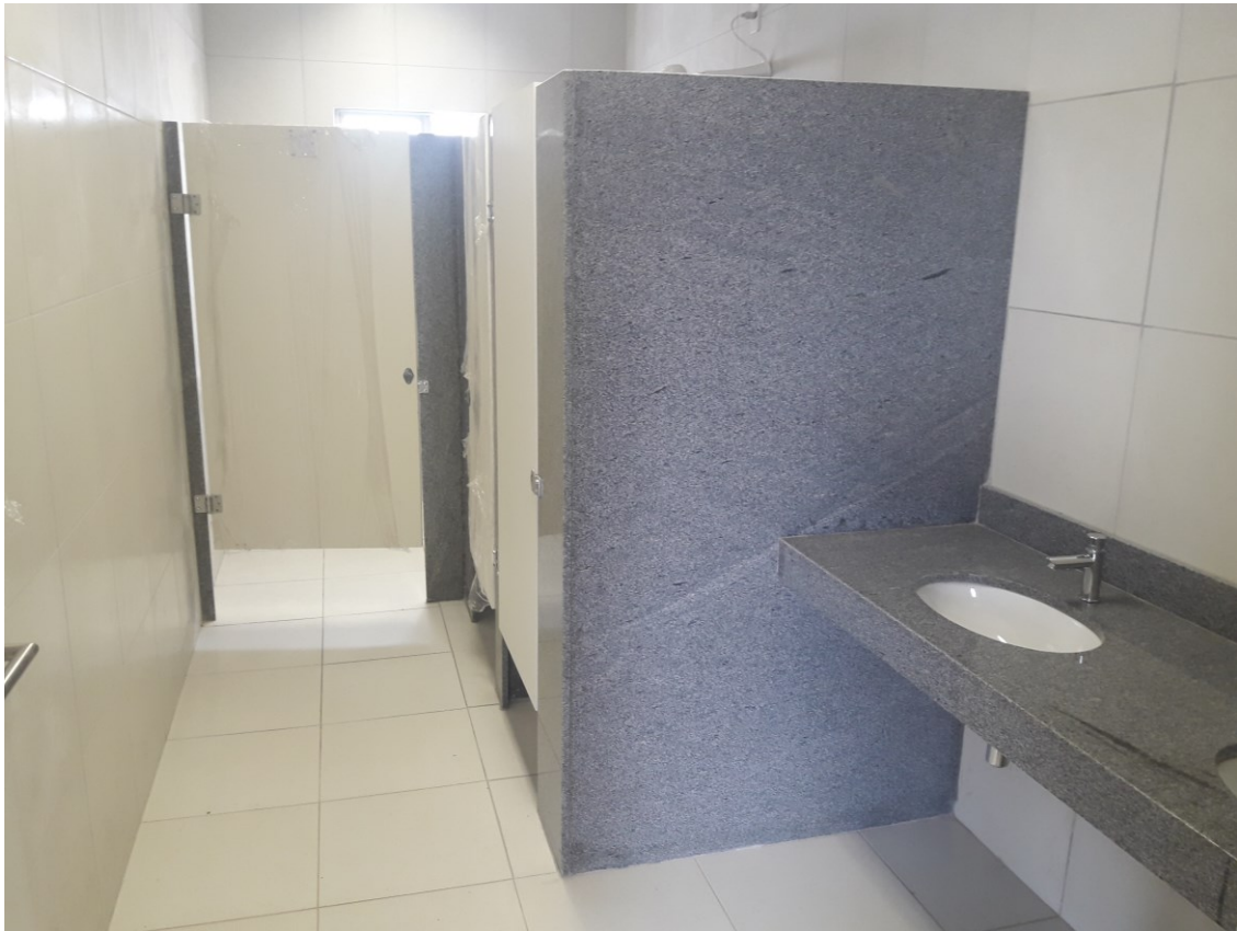
Figura 5 – WC de Servidores (Feminino)