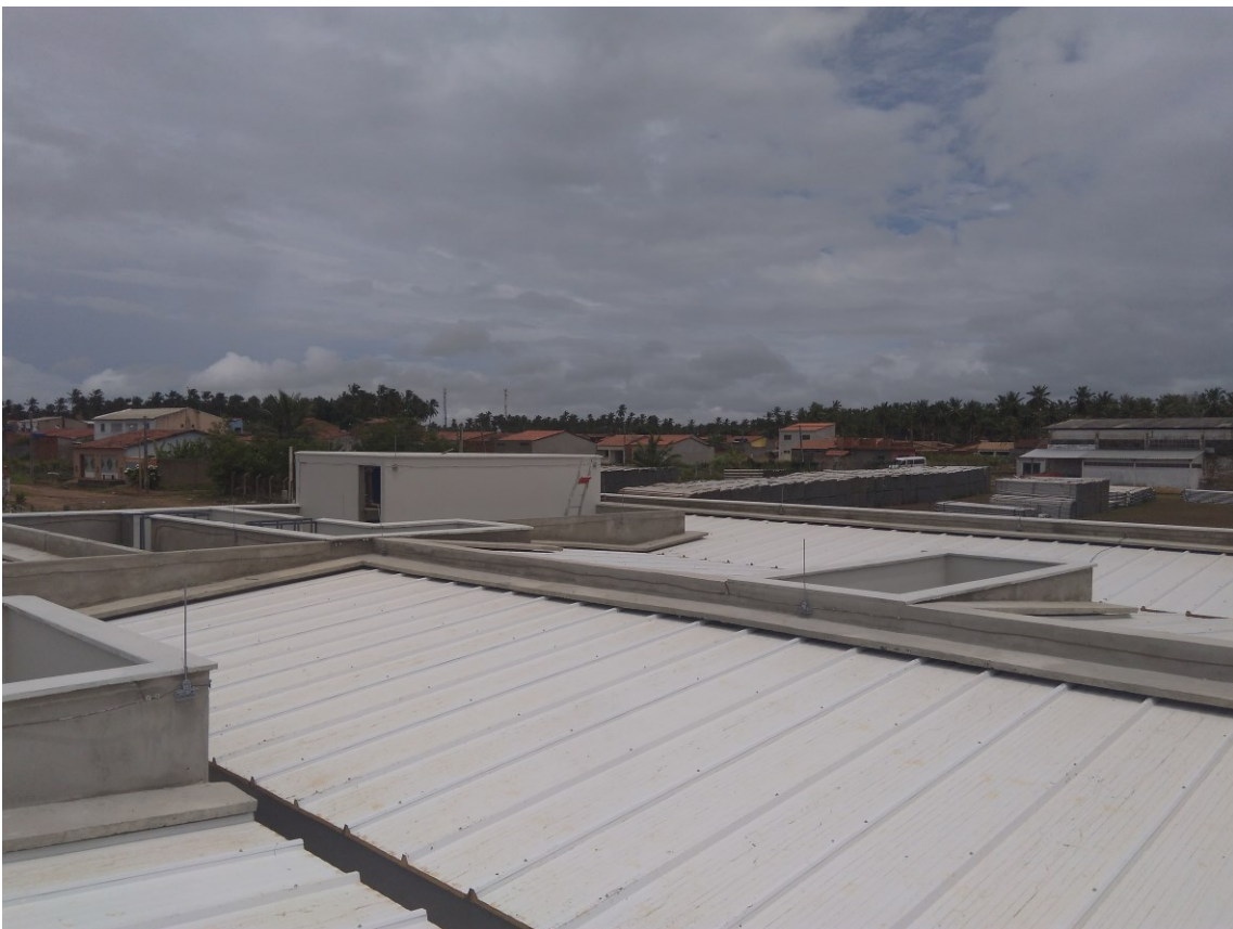
Figura 4 - Coberta