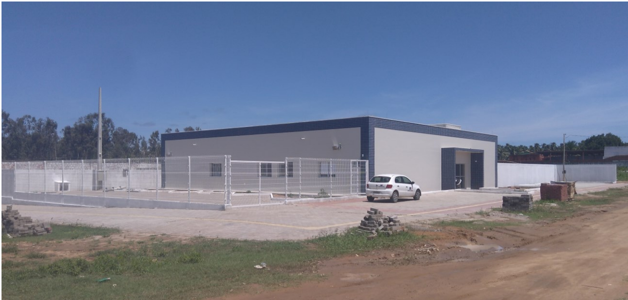
Figura 1 – Fachadas frontal e lateral esquerda