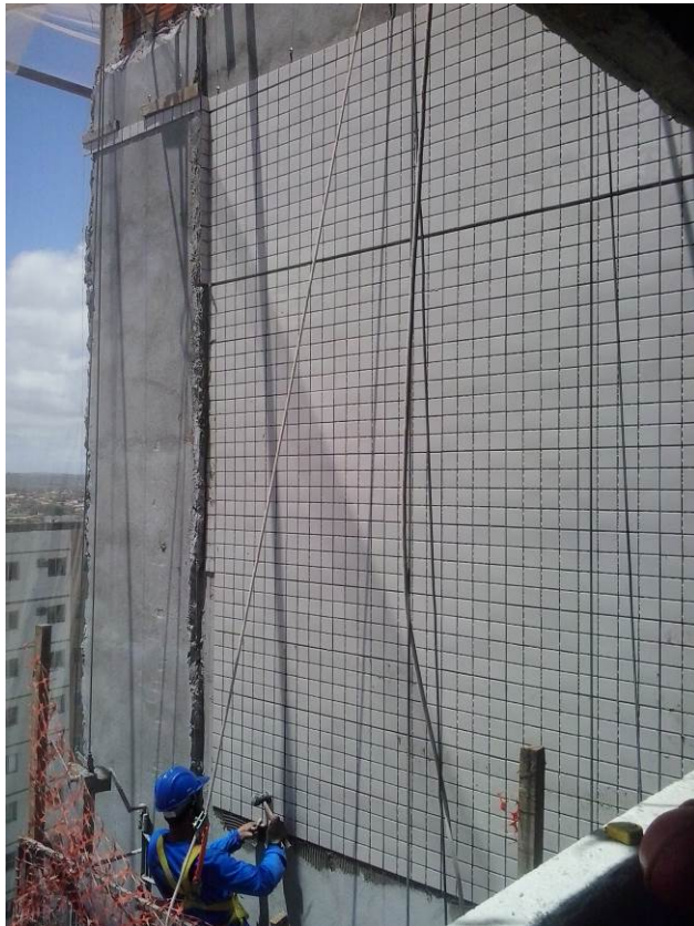
4.14 Aplicação de revestimentos cerâmicos nas fachadas (foto do dia 15/12/2015)