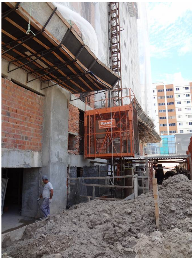
4.10 elevador de obra (foto do dia 15/12/2015)