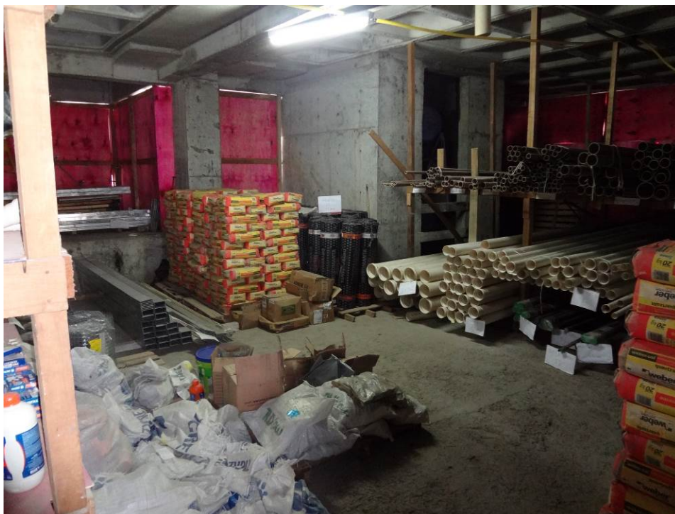
4.8 Argamassas, tubos, eletrodutos, mantas (foto do dia 15/12/2015)