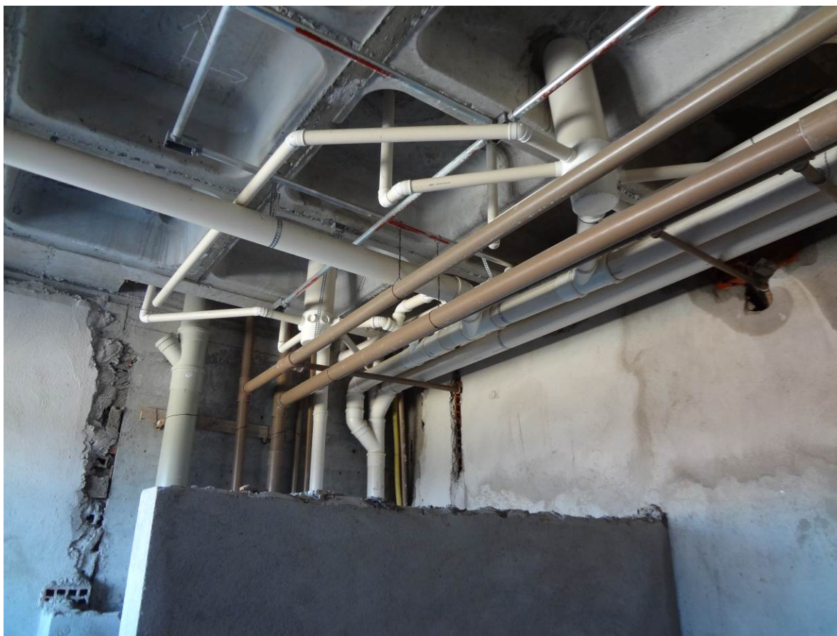
4.5 Observa-se aqui a fixação das tubulações de água (tubo cor marrom) com arames nos eletrodutos galvanizados (tubo cor prata)