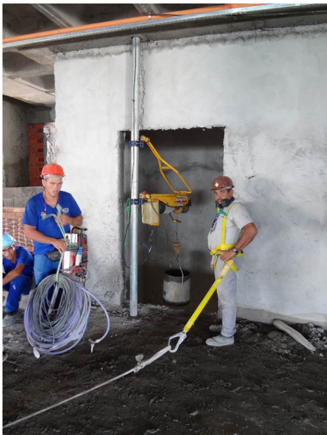
4.11 guincho foguete (foto do dia 15/12/2015)