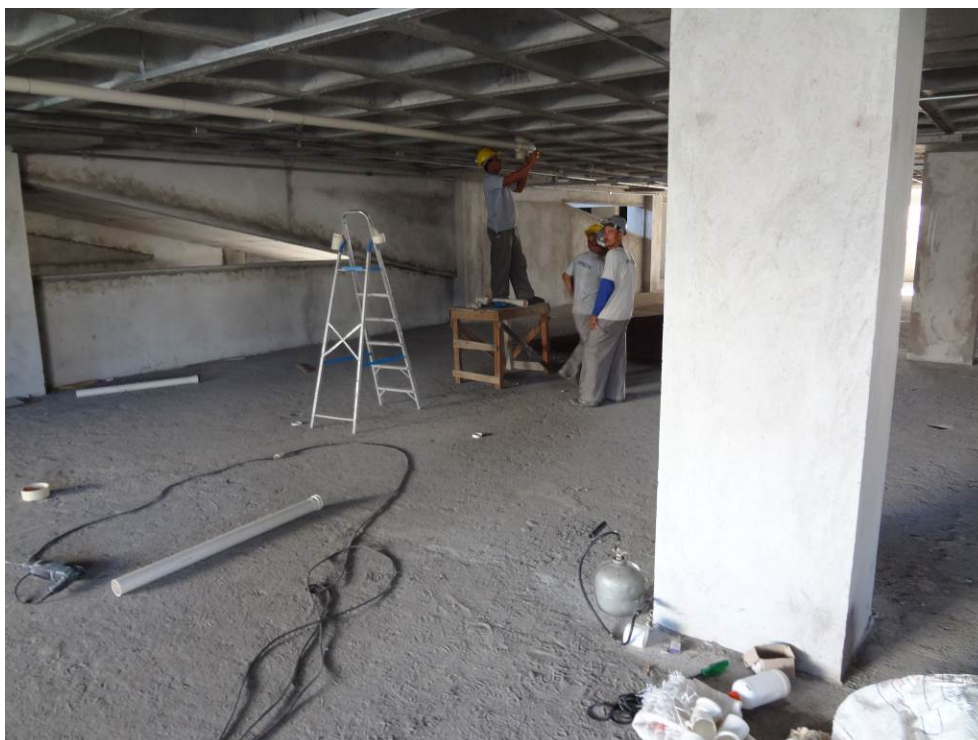
4.12 maçarico próximo do local de execução das instalações hidro sanitárias (foto do dia 15/12/2015)