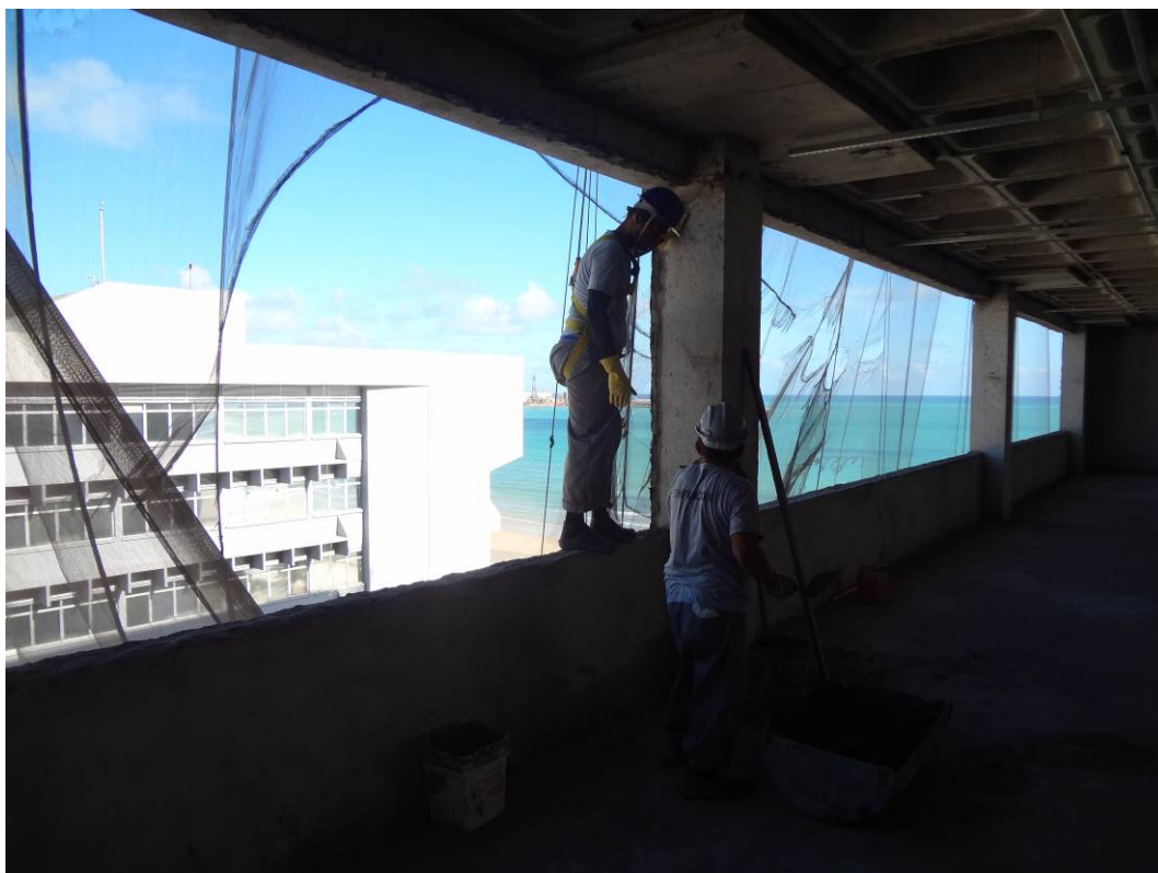
4.13 trabalhador em situação de risco, apesar do uso do cinto, o mesmo não estava preso a linha viva, que garante sua segurança (foto do dia 15/12/2015)