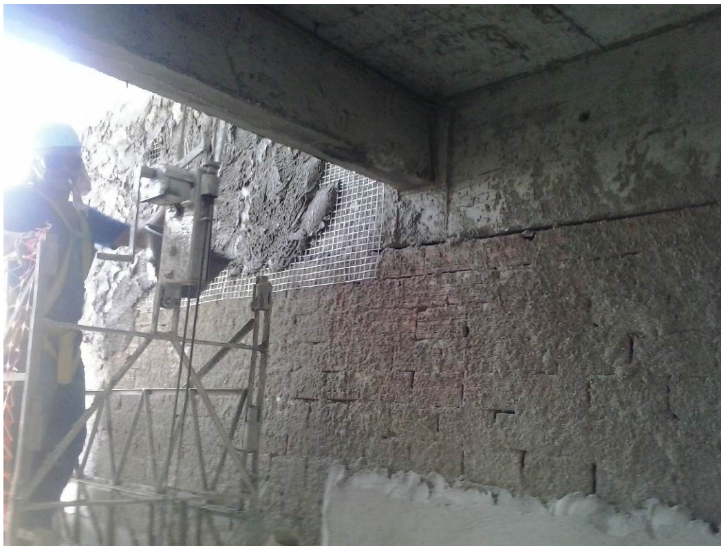
4.15 aplicação de emboço com tela de reforço (foto do dia 15/12/2015)