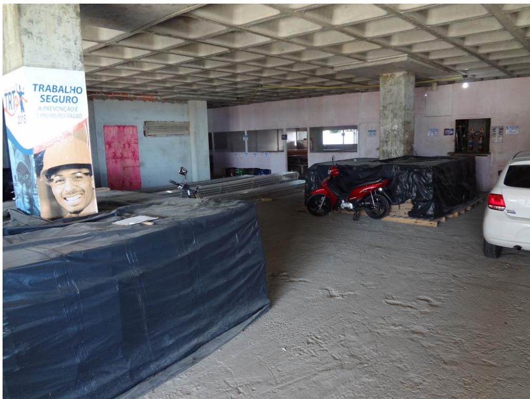
4.7 Revestimentos cerâmicos para a fachada (foto do dia 15/12/2015).