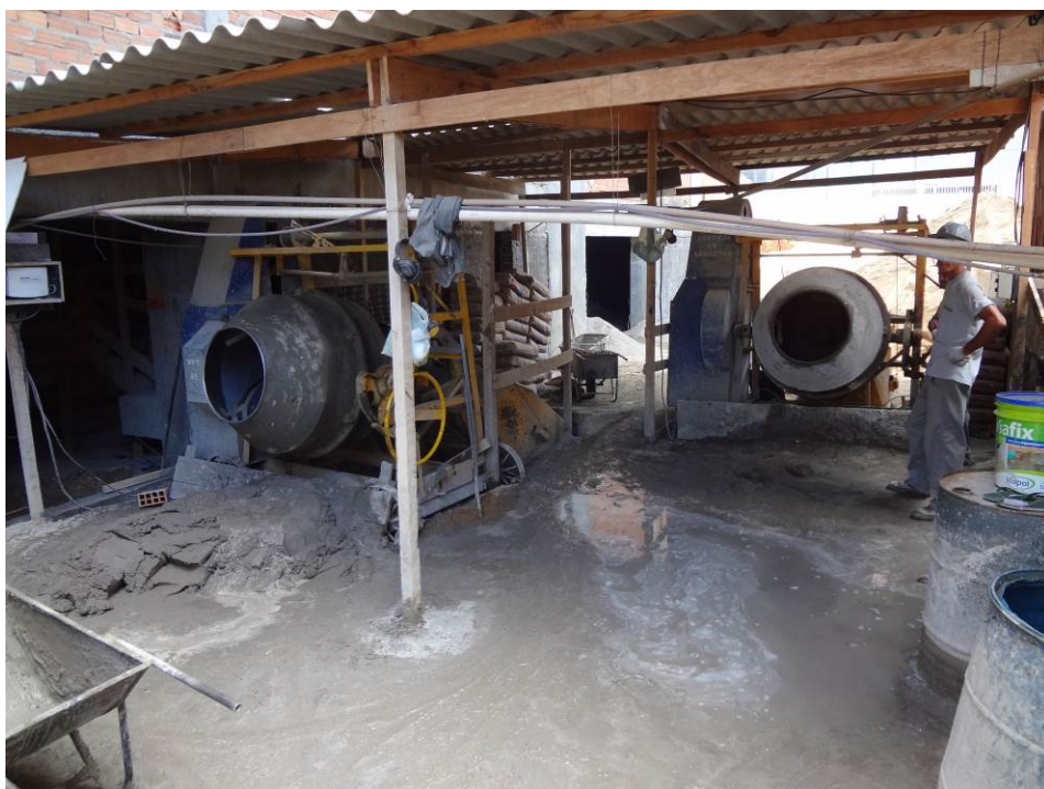
4.9 betoneiras localizadas no subsolo (foto do dia 15/12/2015)