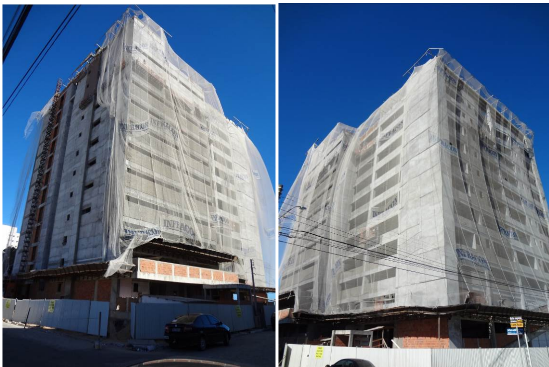
fachadas norte e oeste / oeste e sul (foto do dia 15/12/2015)