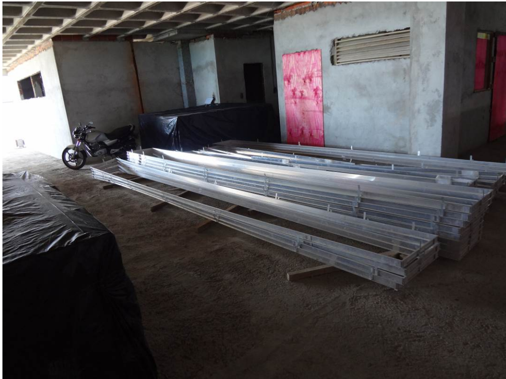
4.6 Contra-marcos para assentamento de esquadrias (foto do dia 15/12/2015).