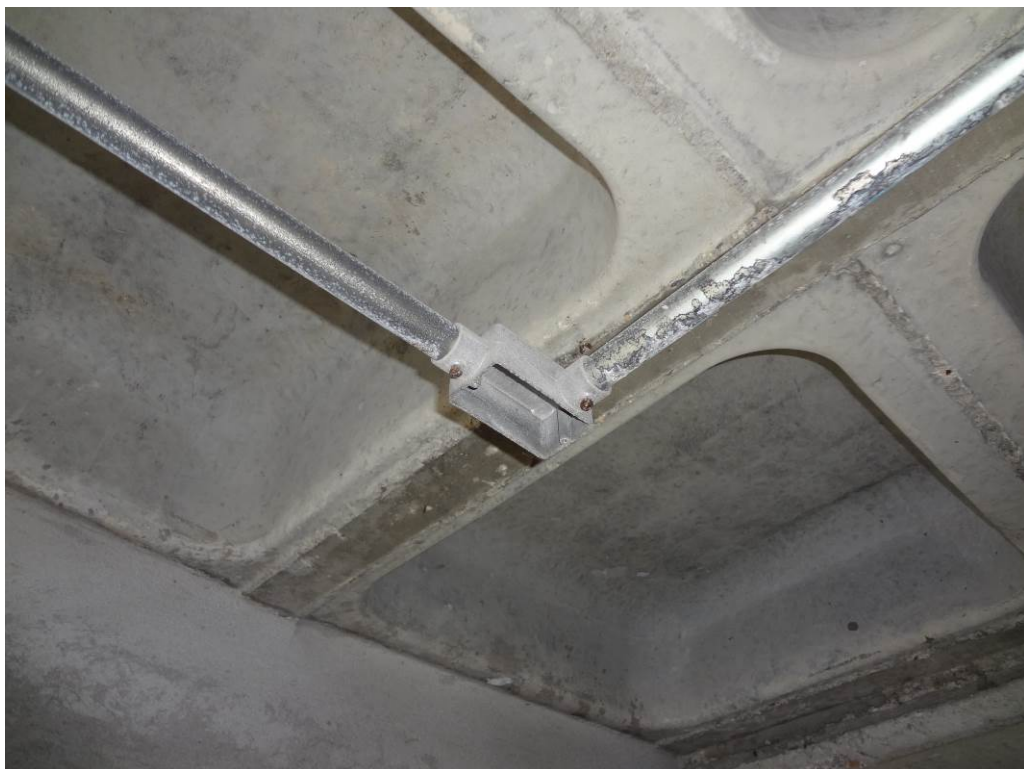
4.17 Eletroduto em processo de corrosão superficial (foto do dia 15/12/2015).