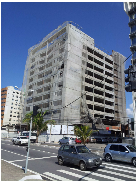
4.3 Fachada principal com a lateral esquerda, foto do dia 11/02/2016.