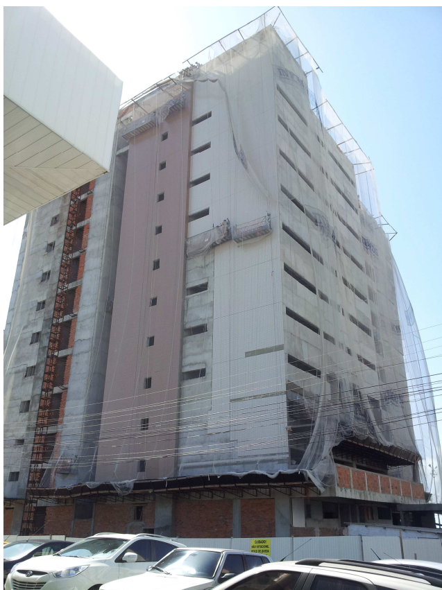
4.2 Fachada posterior, foto do dia 11/02/2016.