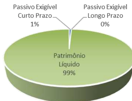
Gráfico 2 – Passivos do TRT19/2021