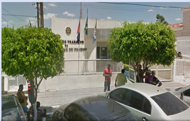
Vara do Trabalho de Santana do Ipanema.