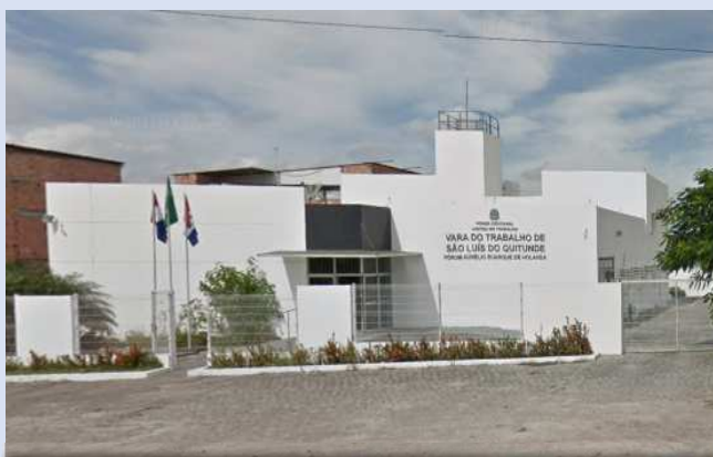
Vara do Trabalho de São Luís do Quitunde.