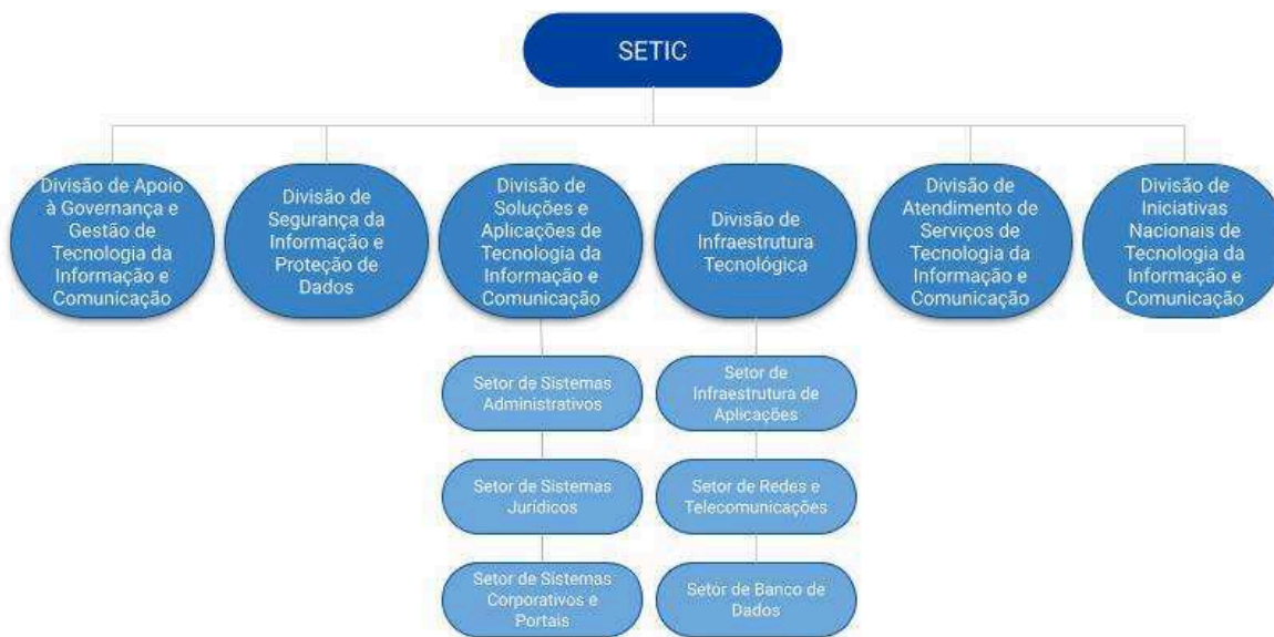
Figura 1: Organograma atual da SETIC.

A SETIC, unidade responsável pela execução da estratégia de TIC no âmbito do Tribunal, encontra-se, no contexto organizacional, subordinada diretamente à sua Diretoria Geral. Sua estrutura hierárquica foi atualizada por meio do Ato Nº. 133/GP/TRT19ª, de 6 de outubro de 2022, e que resultou, até o momento, no organograma ilustrado abaixo: